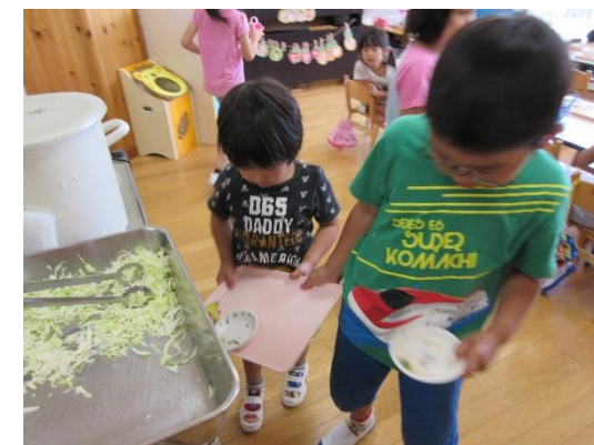
「おさらはここだよ」