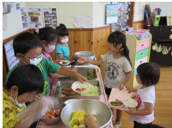
「トレーは一緒にもってあげるね。」

毎週、火曜日と木曜日は、異年齢保育をしています。給食の配膳や片づけなど、大きい子が小さい子に手を添えて教えてあげる姿があちらこちらで見られます。また、食後の時間も特別。いつもと違う部屋で、異年齢の友だちと遊ぶことを楽しみにしています。