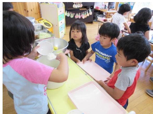
「ごはんは、どのくらい食べられる？」