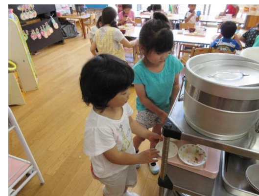
「片づけはこうするんだよ。」