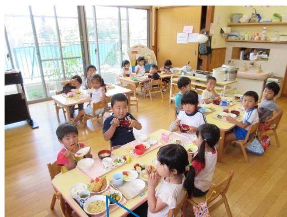
ひまわりぐるーぷ